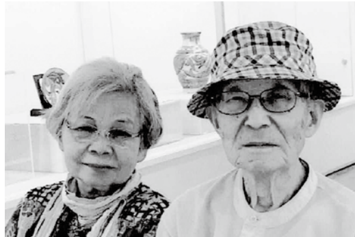
ユンタンザミュージアムにて 薫子夫人と共に