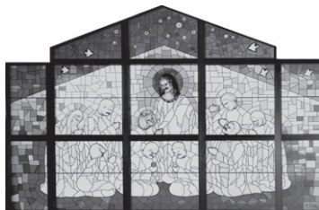
本館ステンドグラス

衣笠病院は1947年8月に日本基督教団立の総合病院として開院し、来年75周年を迎えます。変化する社会の求めに応えつつ、これからもキリストの愛に倣う働きを続けてまいります。