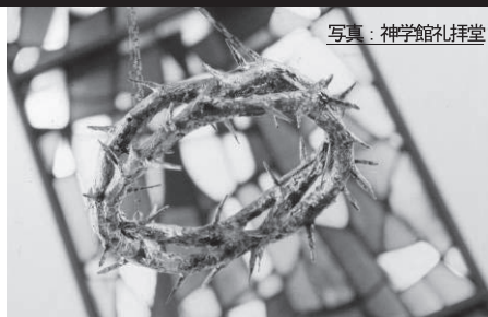
写真：神学館礼拝堂