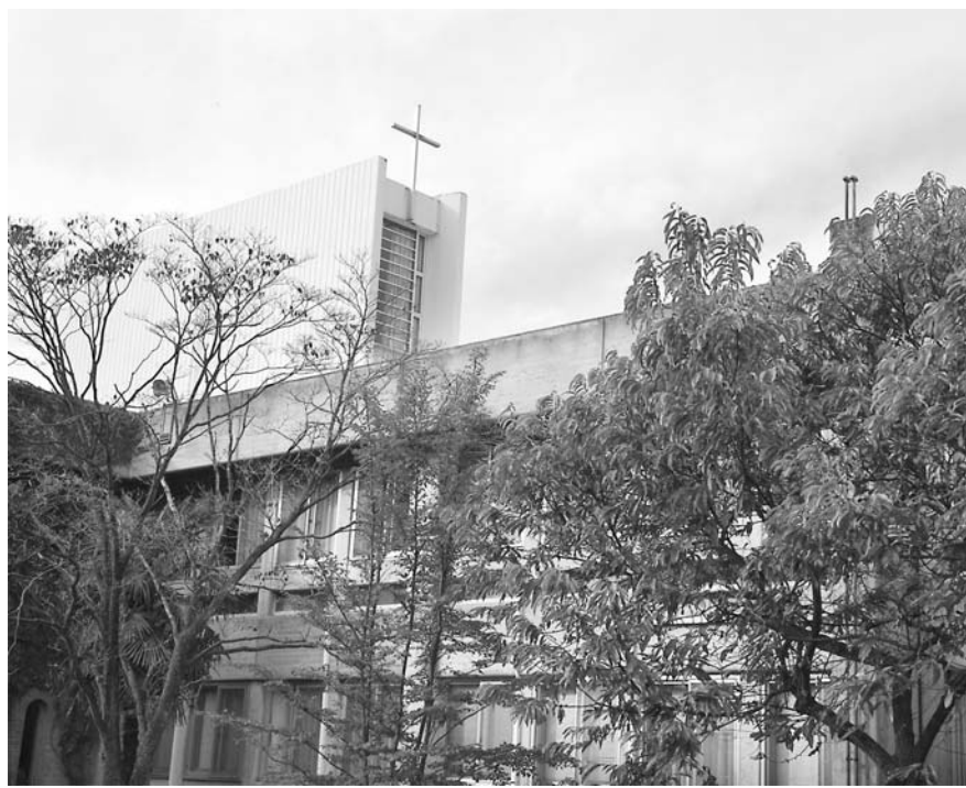
東京神学大学 (三鷹市大沢 3-10-30)

発行所 日本基督教団 169-0051 東京都新宿区西早稲田2-3-18 日本キリスト教会館内 電話 03(3202)0546 FAX 03(3207)3918 発行人 内藤 留幸 編集主筆 竹澤 知代志 印刷所 株式会社きかんし