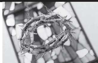
写真：神学館礼拝堂