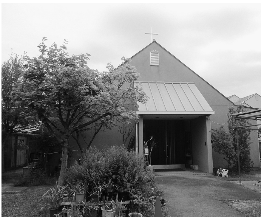
小阪教会 (大阪教区)

発行所 日本基督教団 169-0051 東京都新宿区西早稲田2-3-18 日本キリスト教会館内 電話03(3202)0546 FAX03(3207)3918 URL http://uccj.org 発行人 網中彰子 編集主筆 嶋田恵悟 印刷所 株式会社きかんし