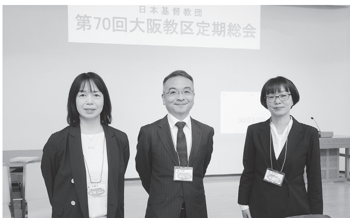
左から、宮岡副議長、尾島議長、東島書記

事日程の承認という形で総会に諮ることとしたことを告げ、「今回は信仰告白をしないという形での礼拝」と述べた。