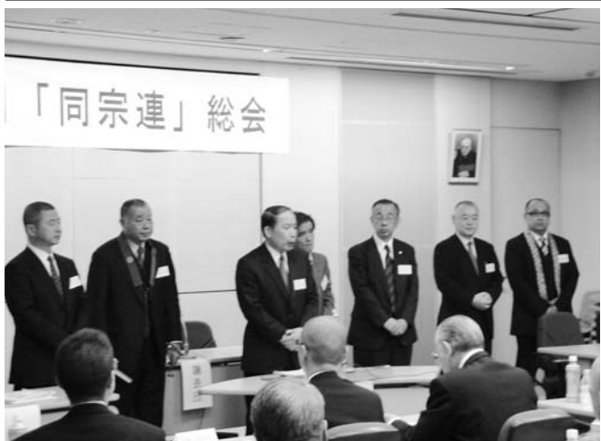
『同和問題』にとりくむ宗教教団連帯会議(同宗連)

発行所 日本基督教団 169-0051 東京都新宿区西早稲田2-3-18 日本キリスト教会館内 電話 03(3202)0546 FAX 03(3207)3918 発行人 内藤 留幸 編集主筆 竹澤 知代志 印刷所 株式会社きかんし