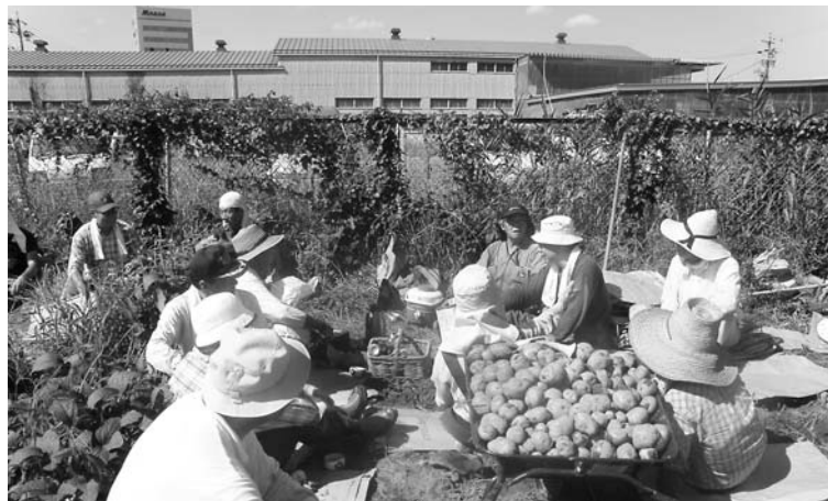
束の間の休憩、一杯の麦茶の美味しいこと！

09年度の各教区総会を概観した時に、聖礼典執行を巡る議論や、教師への戒規適用を巡る議論が突出していた。事柄の重要性と深刻さを思えば、当然のことであろう。しかし、この議論に隠れるようにではあったかも知れないが、実は、各教区総会に共通して、最も頻度高く取り上げられていた議論ないし課題は、他の事柄であった。そのことは、各教区総会の後に開催された、第36総会期第2回常務委員会に報告された教区報告を見れば明らかである。