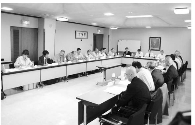
発足から間もなく30年、現在は64教団が加盟

ただ課題もないわけではない。例えば、現在は加盟教団が64教団であるが、以前とはあまり変わらず、今後どのように参加教団を増やしていくかもその一つ。