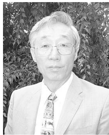
1948 年 2 月 7 日生まれ。広島県福山市出身。丸亀教会員。

自転車通学をしていた中学一年生のある日、小さな女の子にぶつかって怪我をさせたが、謝ることも、両親に告げることもしないまま、事故の場所を避け続けた。ただ恐かった。中学・高校の 6 年間、その事故が重荷となって押しつぶされた。自分分を内に向けたと思う。