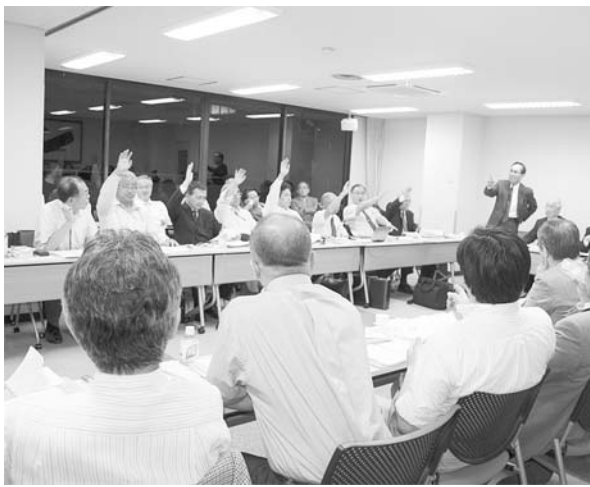
1票差で全数連記案を可決

の提示、議場の承認の提示、議場の承認の提示、議場の承認の提示、議場の承認の提示、議場の承認の提示、議場の承認の提示、議場の承認の提示、議場の承認の提示、議場の承認の提示