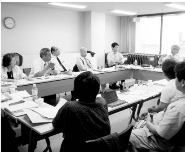
宣教委員会の存在意義を確認

なことであるが、分かち合いたい微妙な部分を持ち出す場所も、シェアする人も身近にはいない、ということを感じた。これは、どこにいても宣教師も同じで、日本で奉仕をしておられる多くの働き人も同様であろう。世界宣教委員会の仕事は、教会や団体との交渉はもちろんであるが、重荷を持つて奉仕しておられる「人」が生き生きと孤立することなく働けるためにあるのだと強く思わされた。そのためには、幹事と職員に対する仕事量が多すぎるのは紛れも無い不幸な事実である。 (世界宣教委員長)